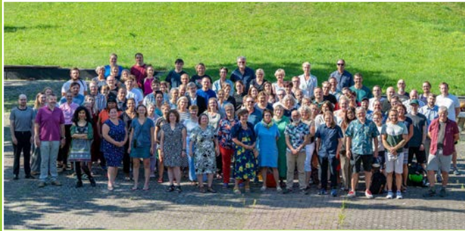
Das Kollegium im Herbst 2023

Seit 40 Jahren verstehen wir uns als das Kompetenzzentrum für Ernährung und Lebensmitteltechnik.